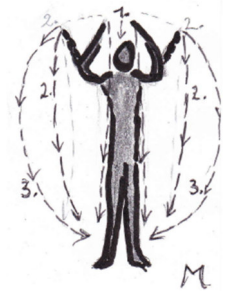
Bild: Der Adler entfaltet seine Schwingen zum Licht - und schwebt majestätisch zur Erde herab. - Das Zwerchfell wie eine Kuppel hoch aufwölben und ruhevoll nach unten absenken.

- Am Ende einen Moment nachempfindend ruhig stehen.