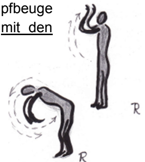
Bild: Einen hellen, durchlässigen Luftwirbel um die Körpermitte erzeugen.

- Am Ende eine Weile nachempfindend ruhig stehen.