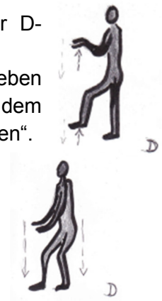
Bild: Auf weichem Waldboden bei jedem Schritt wohltuend und sicher verankert.

- Am Ende eine Weile nachempfindend ruhig stehen.